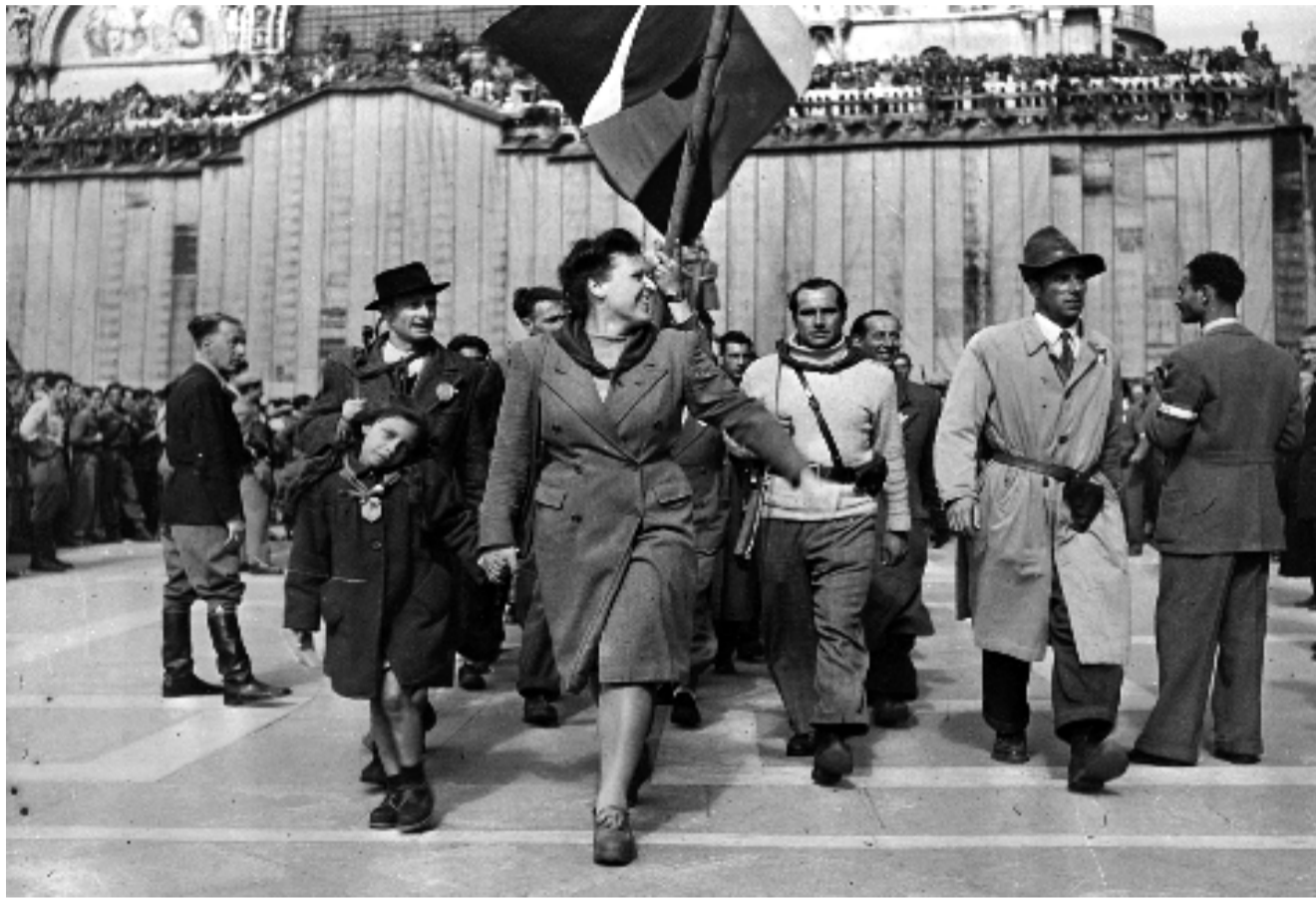
Anche quest'anno, in occasione del 62° Anniversario della Liberazione, l'Istituto Veneziano per la Storia della Resistenza e della Società Contemporanea e le Associazioni Partigiane (ANPI- AVL- FIAP-GL - ANPPA) hanno deciso di far uscire questo numero speciale che vuole essere la testimonianza unitaria di tutte le forze antifasciste cittadine.