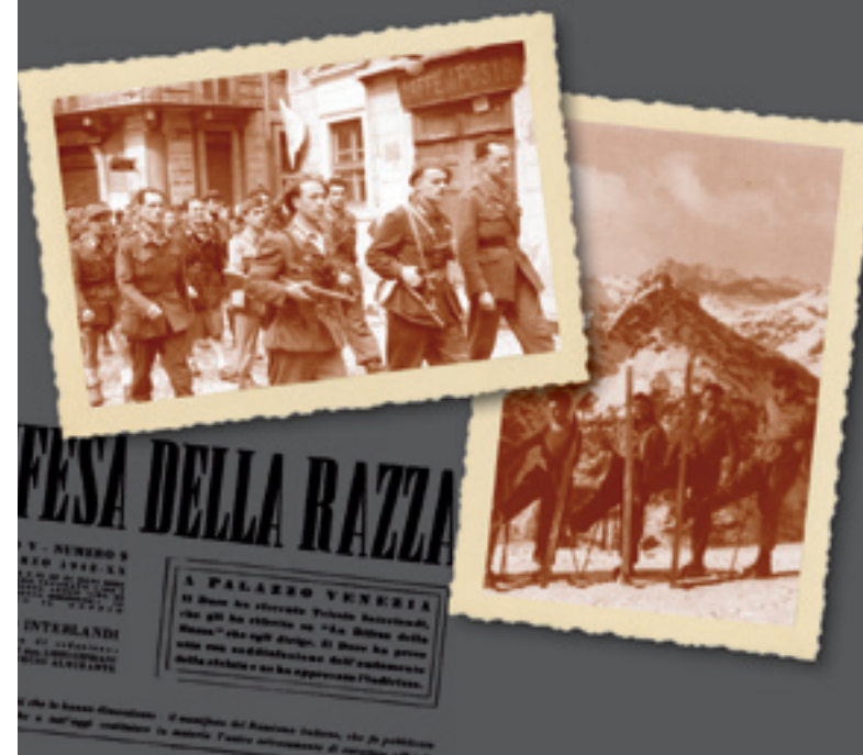
Immagini di Silvio Ortona © Archivio fotografico Luciano Giachetti - Fotocronisti Baita

Roma - Palazzo del Quirinale | Sala delle Bandiere