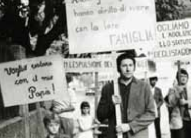
Fotogramma da Lo stagionale di Alvaro Bizzarri, 1971